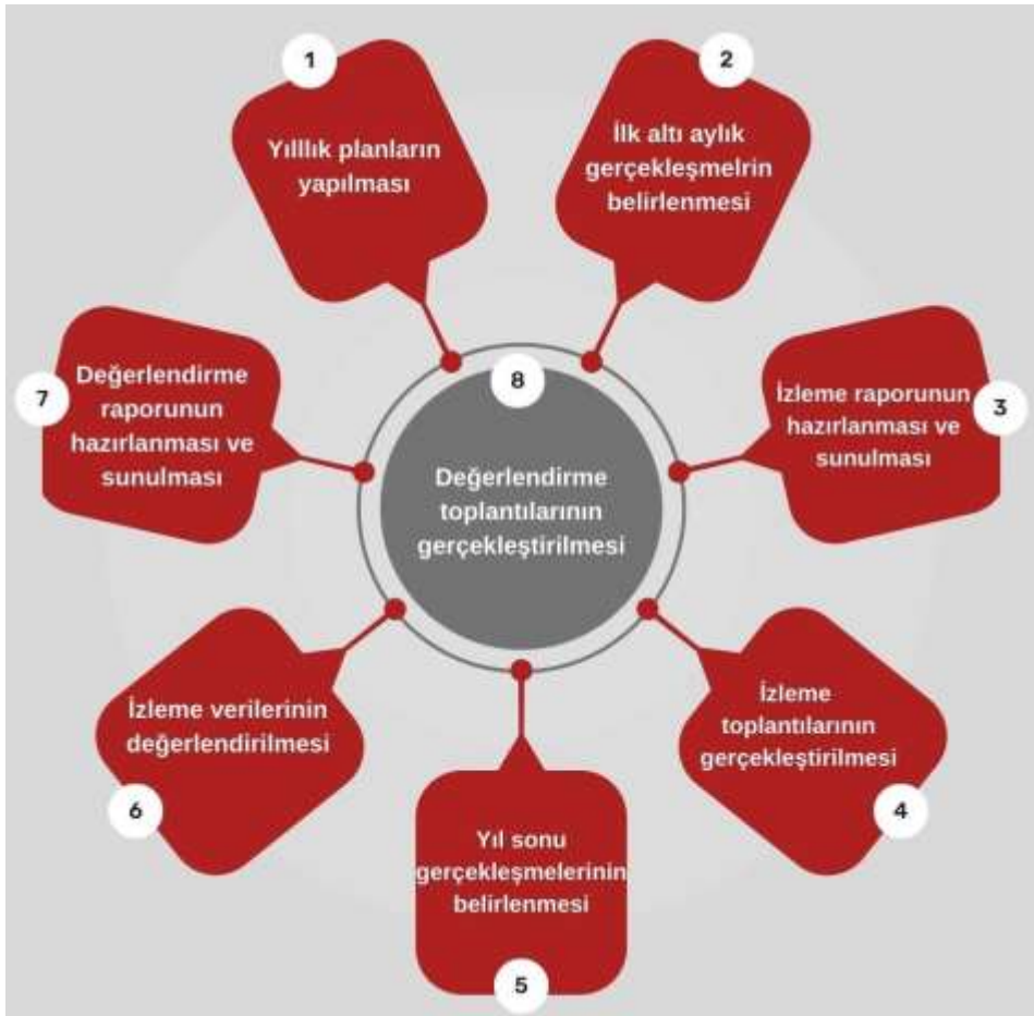
Şekil 4: İzleme ve Değerlendirme Süreci

İzleme ve değerlendirme sürecinin işleyişi ana hatları ile Şekil 4'te özetlenmiştir. Denizli MEM 2024–2028 Stratejik Planı'nda yer alan performans göstergelerinin gerçekleşme durumlarının tespiti yılda iki kez yapılacaktır. Ara izleme olarak nitelendirilebilecek yılın ilk altı aylık dönemini kapsayan birinci izleme kapsamında, MEM Stratejik Plan İzleme ve Değerlendirme Modülü vasıtasıyla, harcama birimlerinden sorumlu oldukları performans göstergeleri ve stratejiler ile ilgili gerçekleşme durumlarına ilişkin veriler toplanarak konsolide edilecektir. Performans hedeflerinin gerçekleşme durumları hakkında hazırlanan “Stratejik Plan İzleme Raporu” Müdür, Müdür yardımcıları, birim amirleri ve kurum içi paydaşların görüşüne sunulacaktır. Bu aşamada amaç, varsa öncelikle yıllık hedefler olmak üzere, hedeflere ulaşılmasının önündeki engelleri ve riskleri belirlemek ve yıllık hedeflere ulaşılmasını sağlamak üzere gerekli görülebilecek tedbirlerin alınmasıdır. Yılın tamamına ilişkin ikinci izleme kapsamında ise MEM Stratejik Plan İzleme ve Değerlendirme Modülü vasıtasıyla, tarafından harcama birimlerinden sorumlu oldukları performans göstergeleri ve stratejiler ile ilgili yıl sonu gerçekleşme durumlarına ait veriler toplanarak konsolide edilecektir.